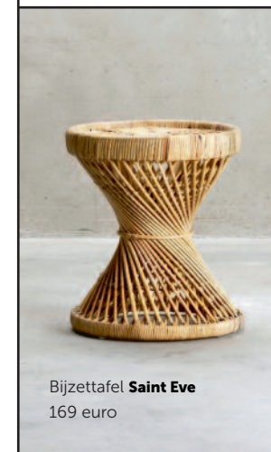
Bijzettafel Saint Eve 169 euro