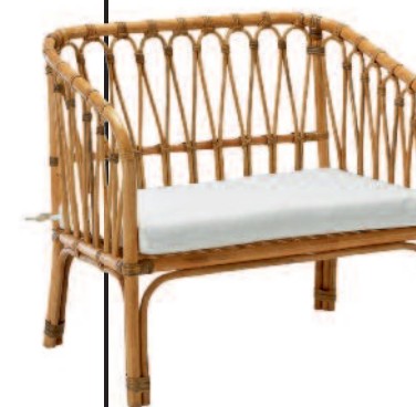
Zetel La Redoute 149 euro