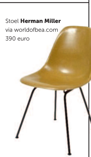
Stoel Herman Miller via worldofbea.com 390 euro