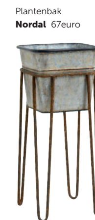
Plantenbak Nordal 67euro