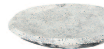
Schaal Luca Beel vanaf 288 euro