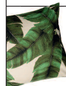
Kussen H&M Home 9,99 euro